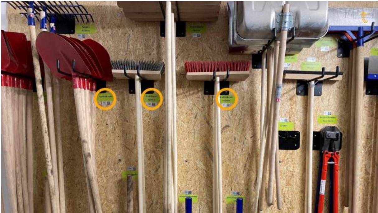
Mengenartikel mit optischer Identifikation