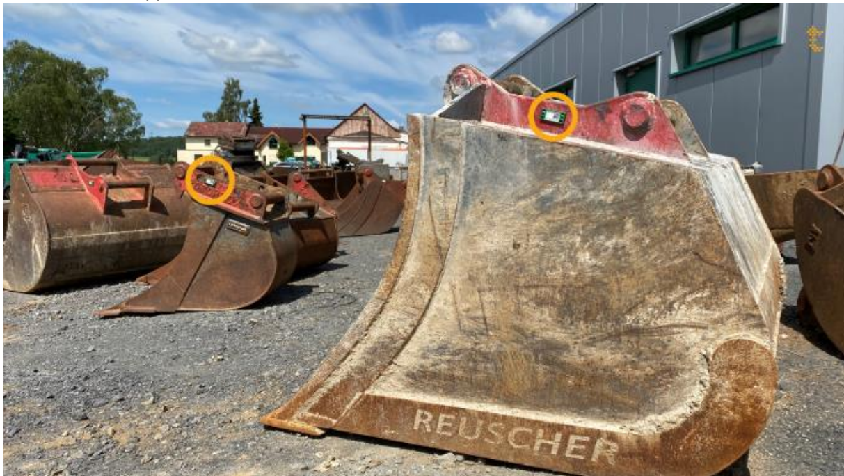
Baggerlöffel mit NFC-Chip